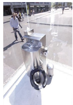
WC - Sicht von innen