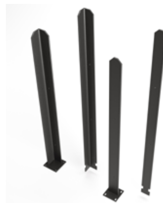
Stahlpostenhöhen TYP 900, 1350 und 1800; zum Einbetonieren oder mit Kopfplatten zum Aufschrauben